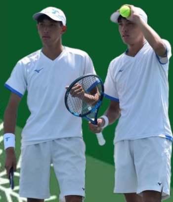
2023 年男子ダブルス優勝増成・増成ペア